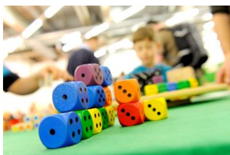
Die Würfel sind gefallen.

München, 11. 09. 2019: Vom 15.- 17. November 2019 lädt das Messeduo SPIELWIESN – Das Spiele-Paradies und FORSCHA – Das Entdecker-Reich zum generationenübergreifenden Freizeitgipfel ins MOC München Freimann.